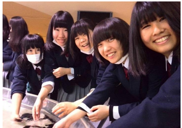
なまこ、かわいい～、きもちいい～