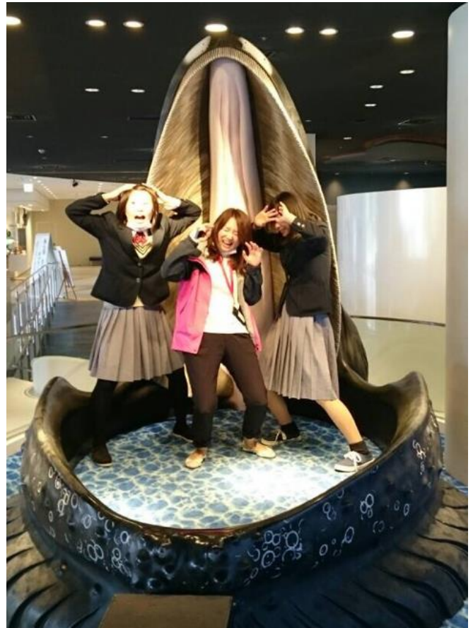
やめてえ～!! 食べないでえ～!!