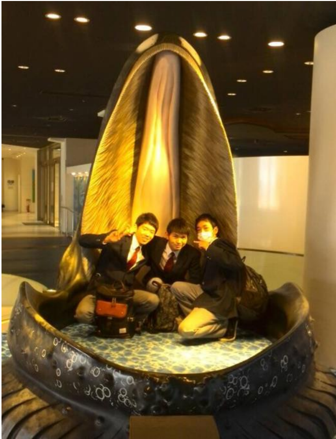
海遊館で男子同士のゆうじょうも深まったよな!!