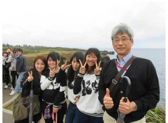
万座毛にて 大自然の力に圧倒されました 雨風が強くても、みんなと一緒になら平気!!